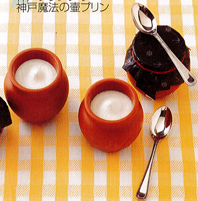
神戸フ란ツの 神戸魔法の壺プリン