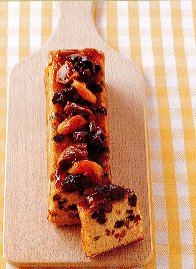
ムッシュマキノの セゾンオフリアル(フルーツ)