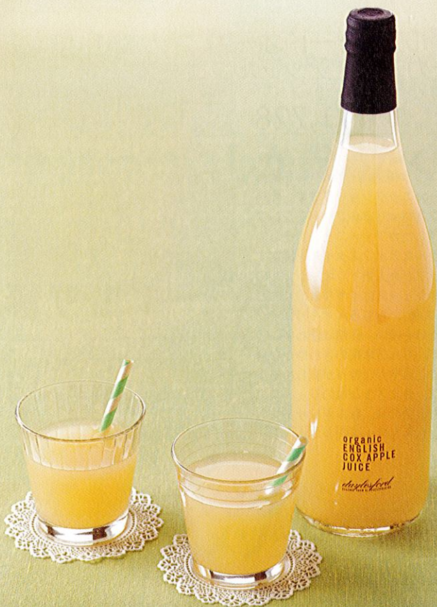
デイルズフォード・オーガニックの オーガニックアップルジュース